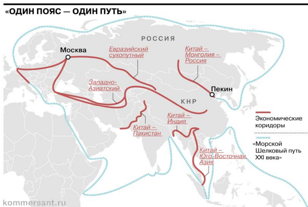
Рис. 4. Схема проекта инициативы «Один пояс – один путь»

Сейчас средний срок доставки контейнерных грузов морским транспортом из Китая в Европу составляет 45–60 суток. В случае успешной реализации проекта этот срок может сократиться до десяти дней.