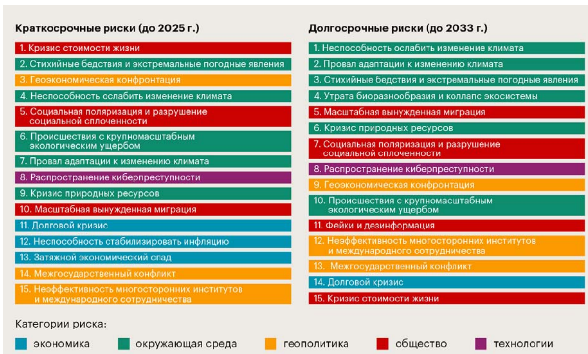
Рис. 5. Топ-15 глобальных рисков на горизонте двух и десяти лет

Глобальный кризис стоимости жизни уже наступил. Цены на товары первой необходимости, прежде всего продовольствие и жилье, быстро росли еще до пандемии; в 2022 г. затраты домохозяйств еще больше возросли, в первую очередь из-за перебоев с поставками продовольствия и энергоресурсов из России и Украины, и инфляционное давление непропорционально сильнее ударяет по тем, кто менее всего способен его выдержать. Чтобы обуздать рост цен, в прошлом году около 30 стран ввели ограничения на экспорт, в том числе продовольствия, что еще больше подстегнуло глобальную инфляцию. Несмотря на то, что давление на цепочки поставок снизилось с последних пиков весны 2022 г., индекс цен на продовольствие остается на максимумах с 1960-х гг.