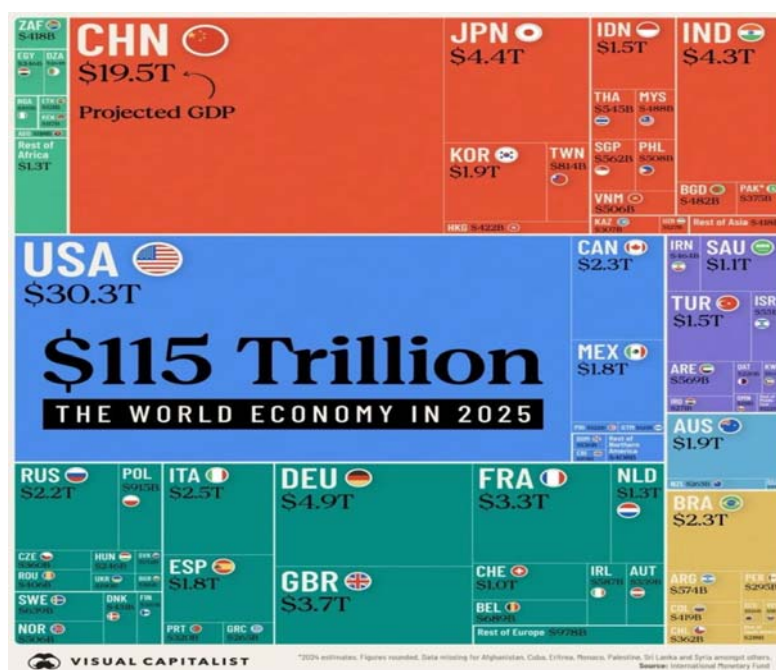
Рис. 1. Данные о номинальном ВВП разных стран и регионов в 2025 г. в долларовом выражении

На диаграмме (рис. 1) приведены данные о номинальном ВВП разных стран и регионов в 2025 г. в долларовом выражении. Экономика США, согласно прогнозу МВФ, останется крупнейшей – ее объем достигнет 30,3 триллиона долларов. Китай сохранит за собой второе место (19,5 триллиона долларов), на третьей строчке – Германия (4,9 триллиона долларов), обогнавшая Японию (4,4 триллиона долларов). Пятерку лидеров замкнет Индия (4,3 триллиона долларов). Россия в рейтинге МВФ занимает 11-е место с показателем в 2,2 триллиона долларов, с долей в почти 2 % в разрезе мировой экономики.