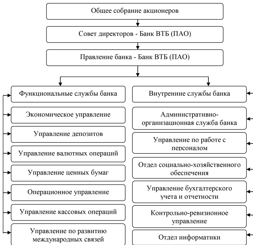
Рис. 4. Организационная структура управления Банком ВТБ (ПАО) 1

Банк ВТБ (ПАО) является вторым по величине активов банком в Российской Федерации. Головной офис банка расположен в Москве, зарегистрирован банк в Санкт-Петербурге.