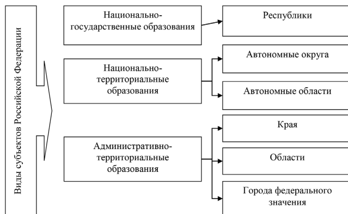
Рис. 2. Виды субъектов Российской Федерации

Обратимся теперь к особенностям бюджетного процесса и бюджетного устройства регионального уровня. Региональный бюджет относится ко второму уровню бюджетной системы Российской Федерации. Структура субъектов Российской Федерации определена и представлена Конституцией Российской Федерации (рис. 2).