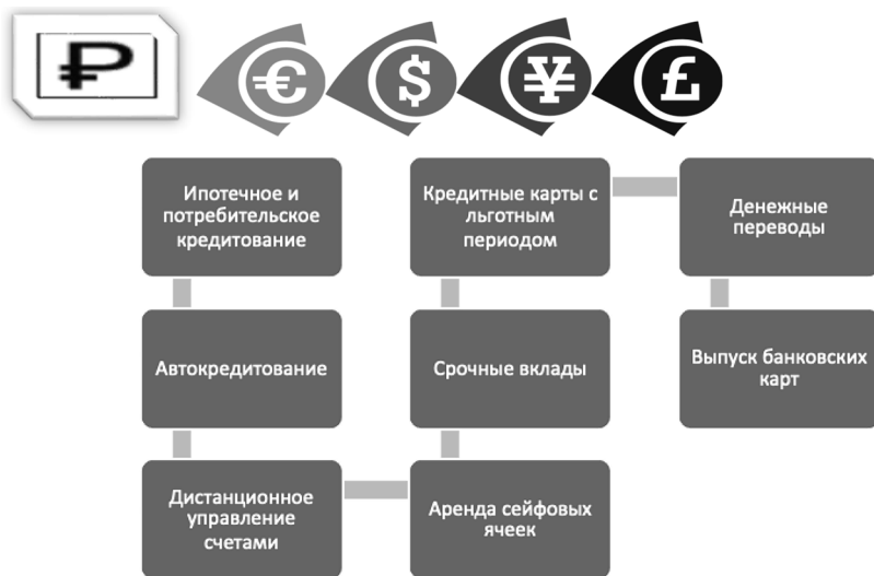
Рис. 5. Услуги, оказываемые Банк ВТБ (ПАО)

Банк ВТБ (ПАО) предоставляет банковские услуги юридическим и физическим лицам. Банк ВТБ (ПАО) осуществляет денежные переводы и срочные вклады в рублях и иностранной валюте. Перечень основных услуг, предоставляемых Банком ВТБ (ПАО), отражен на рисунке 5 1 .